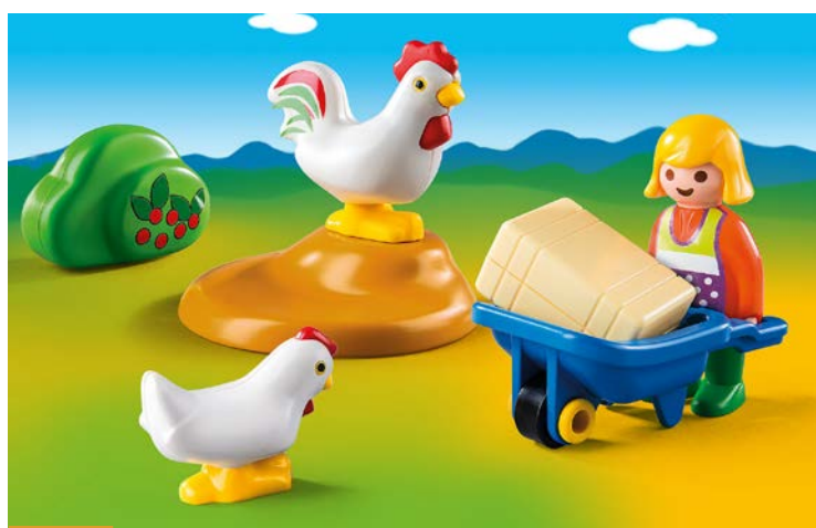
Tracteur pour les garçons, soin aux animaux pour les filles : c'est le programme de Playmobil.

Premier bilan avec Playmobil : aux hommes les tracteurs, aux femmes les brouettes. Dans cet univers, « les femmes ne semblent pas aptes à conduire des engins agricoles. Seuls les hommes semblent l'être ». Même répartition de pratiques et de machines chez Lego. « Les représentations de ces jouets semblent indiquer que les compétences (techniques) des femmes agricultrices s'arrêtent là où commencent celles des